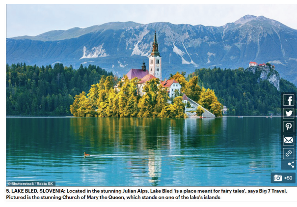
5. LAKE BLEED, SLOVENIA: Located in the stunning Julian Alps, Lake Bled 'is a place meant for fairy tales', says Big 7 Travel. Pictured is the stunning Church of Mary the Queen, which stands on one of the lake's islands

Spletni portal Big seven Travel je na osnovi izbire 1,5 milijona spletnih vplivnežev na Instagramu z vsega sveta oblikoval lestvico 50 najprivlačnejših krajev na svetu v letu 2020, Bled je na odličnem 5. mestu. Članke s seznamom je objavilo več vplivnih svetovnih medijev, med njimi Daily Mail in The Guardian :